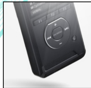
Robuste Konstruktion für den Diktieralltag